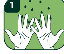
1 Ellerinizi ıslatın