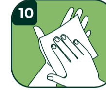
10 Tek kullanımlık havlu peçete ile kurulayın