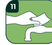
11 Peçeti ile musluğu kapatın