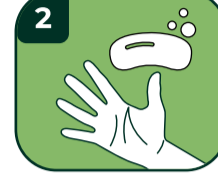
2 Sabun sürün