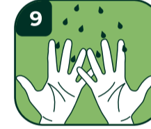
9 Ellerinizi durulayın