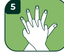
5 Parmak aralarını yıkayın