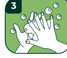
3 Ellerinizin avuç içlerini ovun