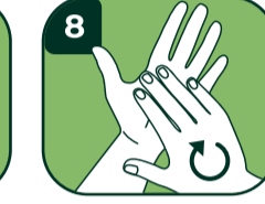
8 Tırnak ve parmak uçlarını yıkayın