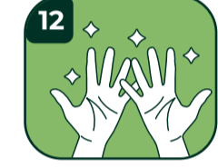
12 Elleriniz artık temizlendi