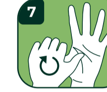
7 Baş parmakları temizleyin