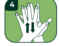
4 İki elin arkasını köpürtün